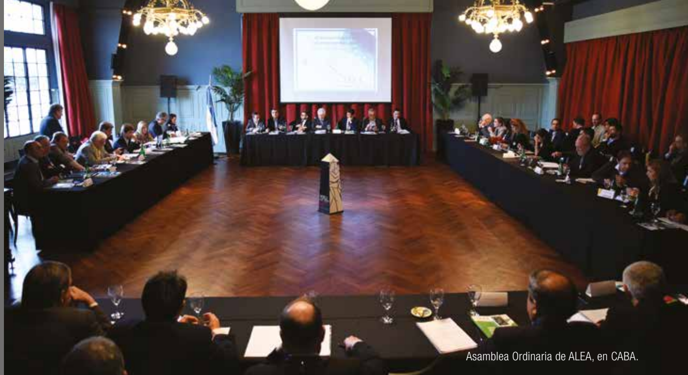
Asamblea Ordinaria de ALEA, en CABA.