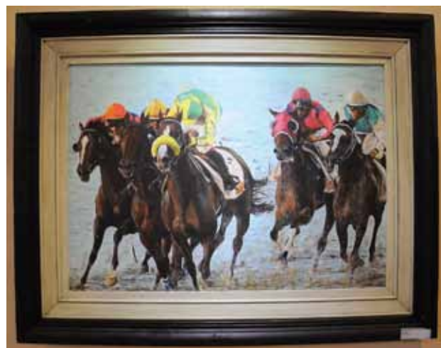
La Galería de Arte del IAFAS, a cargo de la División Promoción, perteneciente al área de Comunicación y Relaciones Institucionales, brinda la posibilidad de admirar distintas piezas artísticas.

Dubs afirma que para el área es importante darle continuidad a los objetivos ya logrados, “y dedicarnos a cumplimentar la unificación y homogeneización de la imagen de todos los casinos y salas de juegos de la provincia, como también mejorar la señalización interna en cada uno de ellos y en nuestra casa central”.