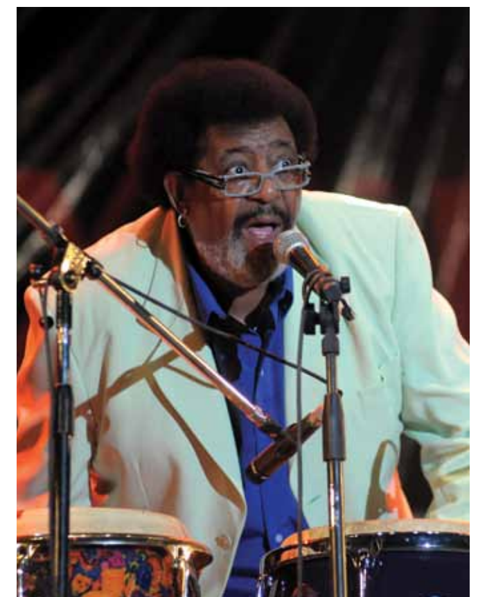
Pedro Aznar y Rubén Rada animaron una nueva edición de la Fiesta Nacional del Mate en Paraná.

Otro clásico de esta celebración es el concurso de Cebadores de Mate, que concita enorme interés.