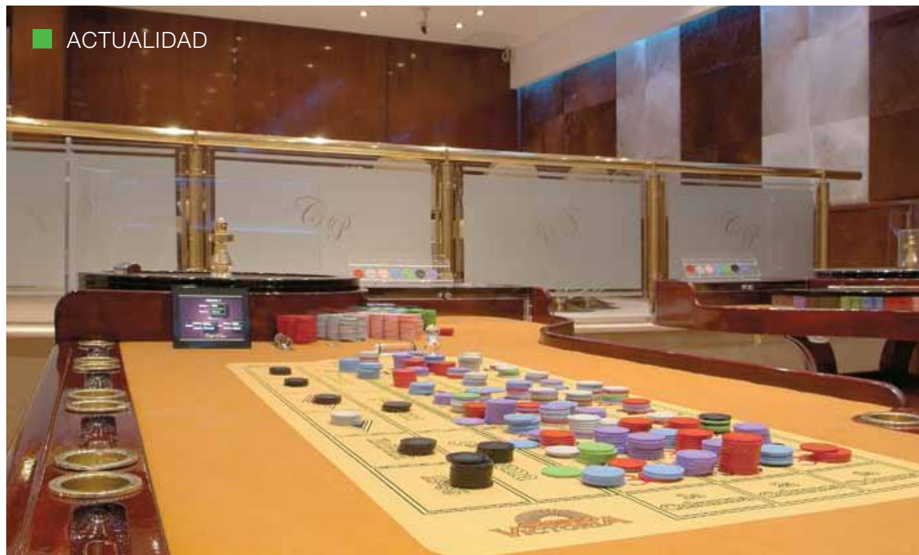
“Club Privé” ofrece un ambiente totalmente privado y reservado en sus más de 150 m 2 , distribuidos en tres niveles, donde se ubican cuatro mesas de cartas y tres ruletas.

cortesías, definir los mínimos y máximos de las apuestas (siempre de común acuerdo con el IAFAS, que es el órgano de contralor), “algo tan sensible a la voluntad de cada uno de los jugadores a la hora de decidir en qué casino jugar”.