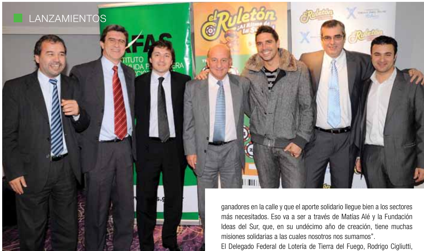
Autoridades del IAFAS junto a representantes de El Rulotón, durante la ceremonia de lanzamiento del nuevo juego en Entre Ríos.