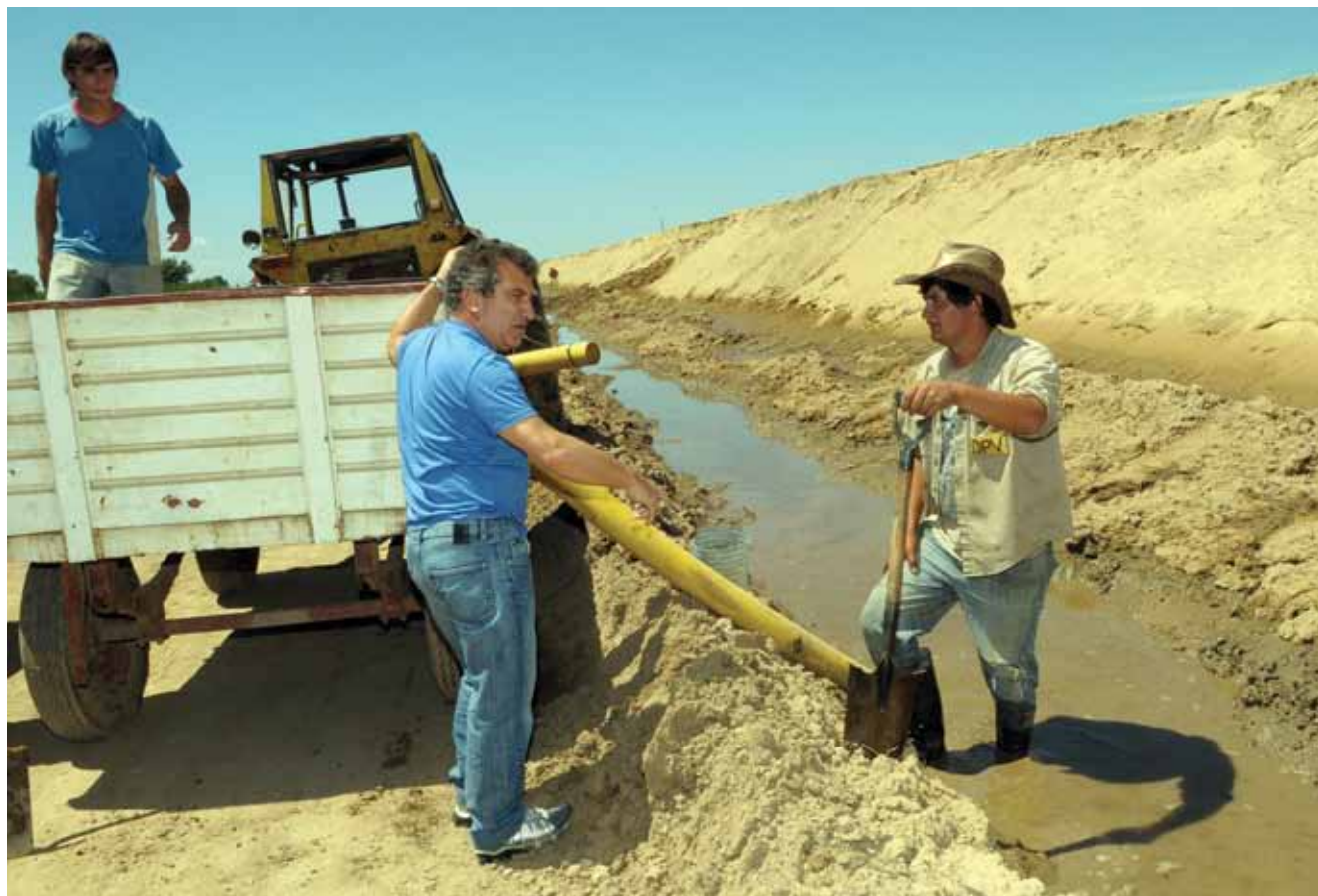
Para Guillermo Federik, “Entre Ríos debe seguir creciendo enmarcada en el proyecto político nacional, popular y democrático que le da sentido y contenido al crecimiento, encabezado por el Gobernador Sergio Urribarri” (foto).

-Enmarcada en el proyecto político nacional, popular y democrático que le da sentido y contenido al crecimiento, encabezado por el Gobernador Sergio Urribarri. Con la recuperación del rol del Estado como actor fundamental en los procesos de desarrollo, y garantizando el crecimiento sostenido de una economía basada en la producción y el trabajo, la mejora de la competitividad, una mayor inversión pública en educación, salud e infraestructura, y con inversiones privadas en múltiples rubros de la producción. En otros términos, con inclusión social y garantía de los derechos básicos a vastos sectores sociales que, históricamente, han sido postergados, más la valoración y la protección del ambiente y de los derechos humanos, y el equilibrio de las cuentas públicas. Y también, con planificación estratégica, sentido sinérgico; enfoque territorial, ascendente y multisectorial, y con generación de planes y programas operativos de gestión y acción sobre cada materia de todas las actividades estratégicas. ■