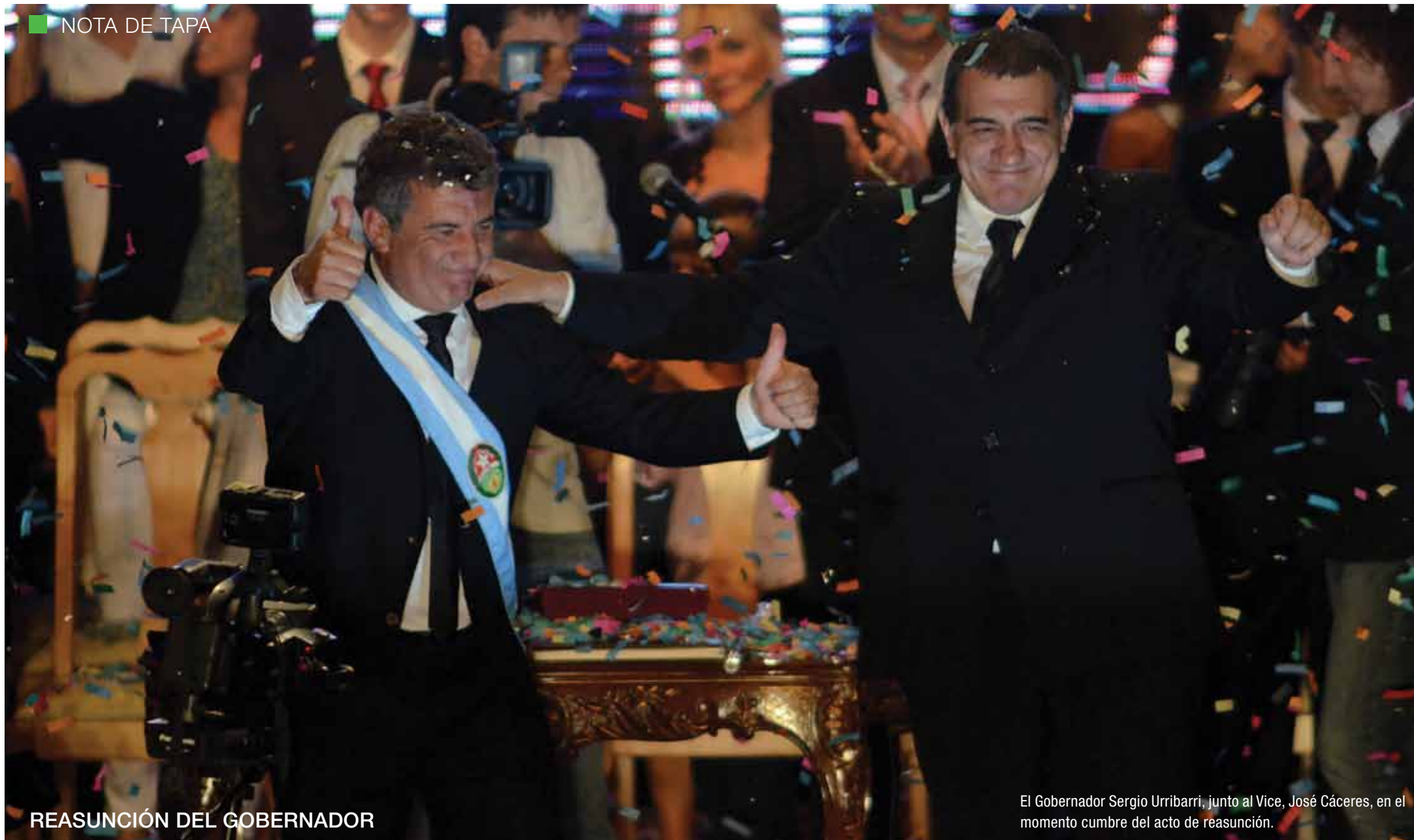
REASUNCIÓN DEL GOBERNADOR