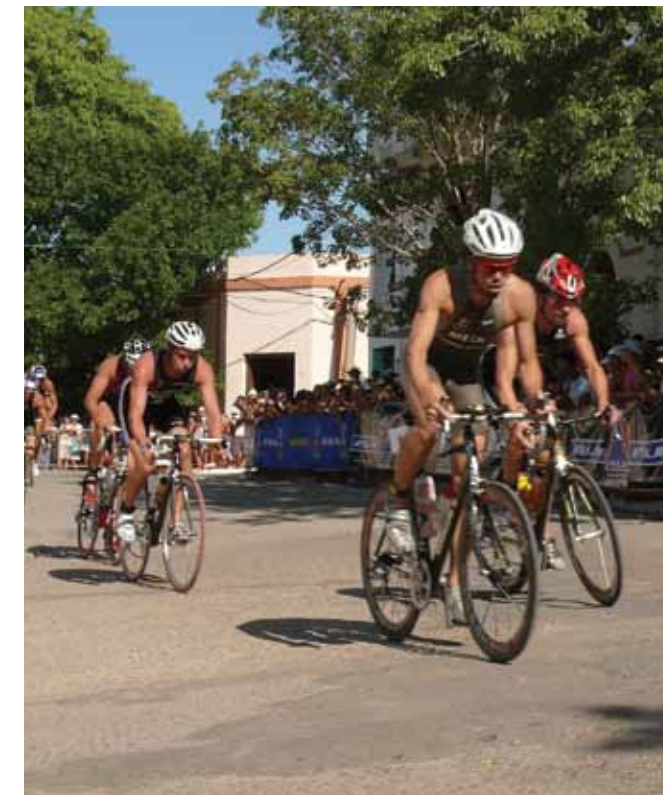
Enfrente: Una postal de La Fiesta Nacional del Lago, en Federación. Arriba: La Paz, como todos los años desde 1985, fue sede del Triatlón Internacional.

En lo referido a actividades diurnas, la fiesta se destacó por la variedad de actividades. El encuentro de Fútbol Selección Sub 15; el Concurso de Castillos de Arena en Playa Grande para niños; el Torneo Regional de Paddle; el Seven de Hockey; el Concurso de Pesca Infantil; el Campeonato Provincial de Beach Vóley; el Concurso de Pintores Paisajistas "Costas de mi ciudad"; el Encuentro de Pequeños Pintores para niños; los paseos en catamarán para recorrer Playa Grande, Playa Baly, Puerto y vieja ciudad; los paseos en bici flot, kayak, gomones, banana de arrastre, tobogán y trampolín, además de velero; el Básquet 3 x 3 libre; spinning; clases de aeróbica localizada, power y kimax; exhibición de remo a cargo de la Escuela de Remo de Federación; la Carrera de Mozos, el Torneo Libre de Pesca, la Competencia de Mountain Bike; y la Caravana náutica por las playas, por donde paseó la electa Reina Nacional del Lago.