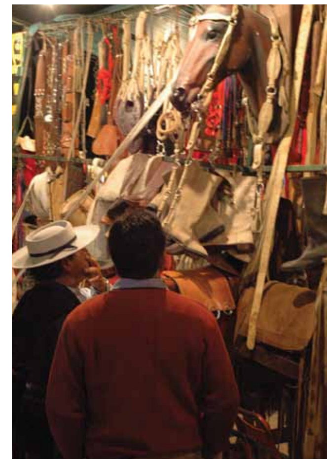
Abajo: Artesanías en la Festival Nacional de Jineteada y Folklore, en Diamante.