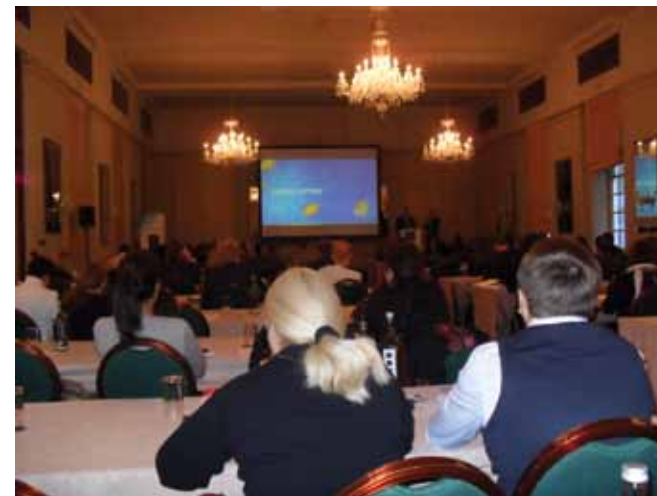
El seminario contó con importantes expositores, representantes de diversas loterías de Europa y algunas de América, como Canadá y Brasil.

azar; los desafíos que ello implica y la importancia de tomar medidas para su regulación. Está bien claro que el mercado ya ha evidenciado la tendencia hacia la aplicación de nuevas tecnologías al juego, y los organismos reguladores deben hacer frente a esta problemática sobre la base de la normativa vigente en cada uno de los países". ■