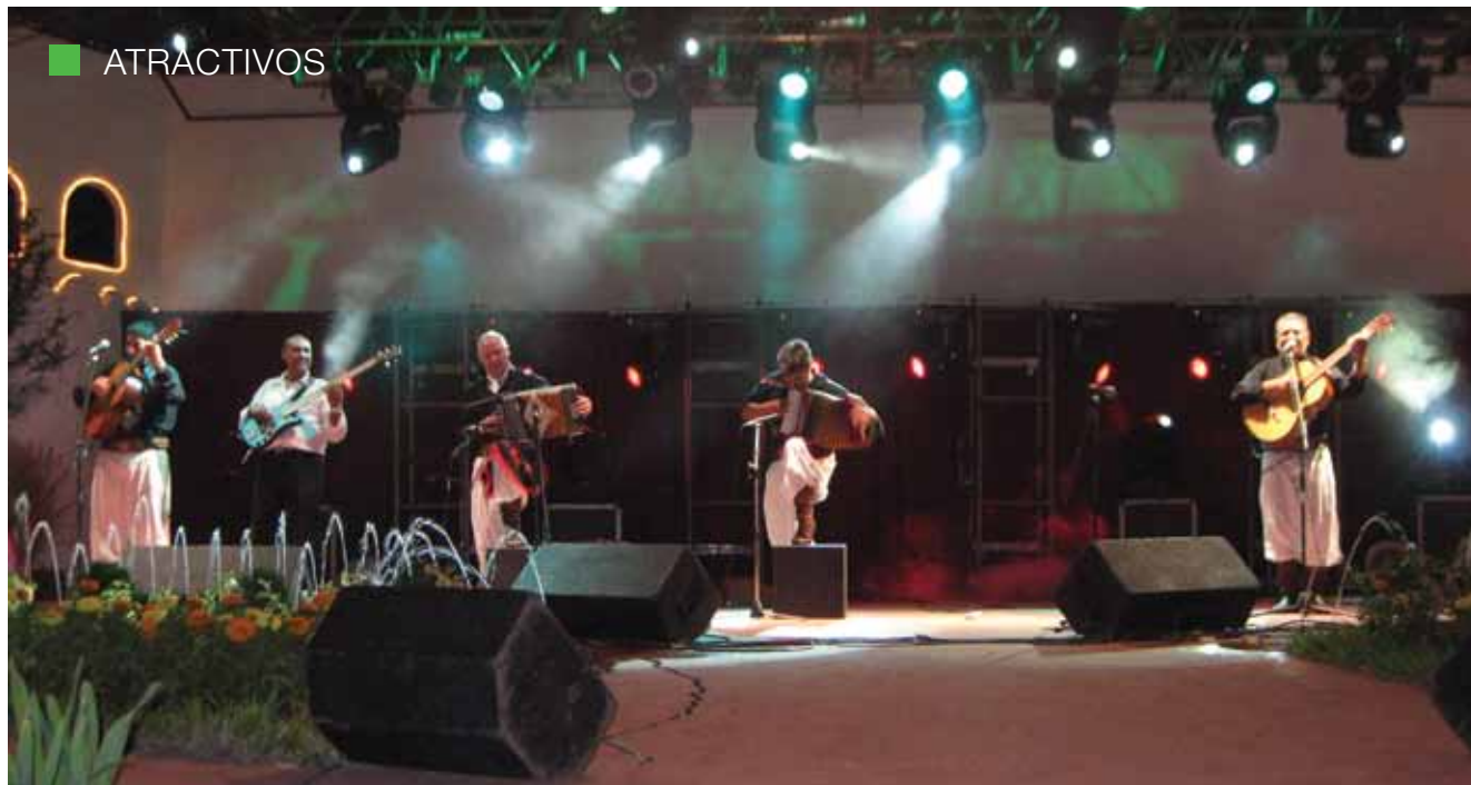
Febrero es el mes más esperado en Federal, ya que todos los años la ciudad renueva su espíritu chamamecero en el Festival Nacional del Chamamé. Abajo, otra postal del Carnaval del País.