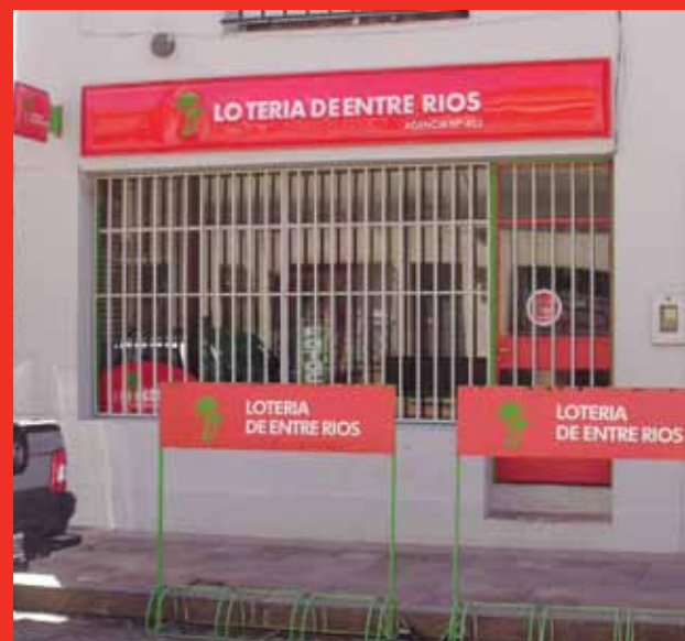
Cuatro agencias de Gualeguay que ya lucen totalmente renovadas: las número 433, 1158, 135 y 181.