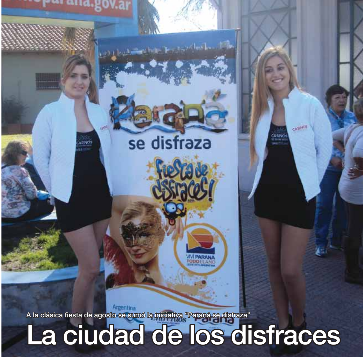
A la clásica fiesta de agosto se sumó la iniciativa "Paraná se disfraza"