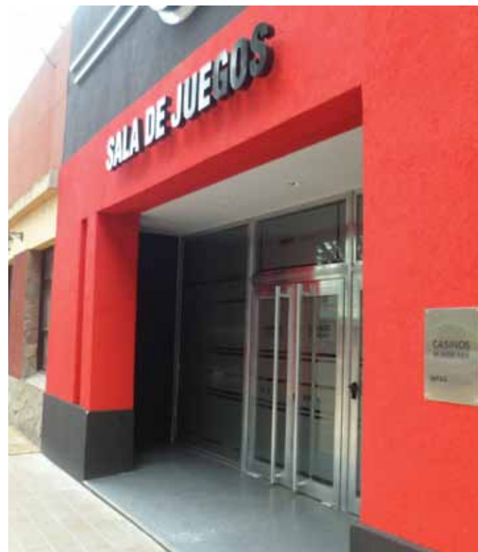
La flamante fachada de la Sala de Entretenimientos de Rosario del Tala, ubicada en calle Sáenz Peña 292, renueva la postal del centro de la ciudad.

DATOS ÚTILES Ubicación: Sáenz Peña 292, en el corazón de Rosario del Tala. Horario: Todos los días, de 16 a 4. Entretencimientos: 58 máquinas tragamonedas y ruleta electrónica con ocho puestos individuales. Además, shows musicales en vivo los viernes y sorteos de $ 2.000 los miércoles. Servicios: Variedad en materia de gastronomía –con barra, mesas y sillas–, guardarropas, seguridad privada y cobertura de primeros auxilios. Novedades: Sector para shows; ambiente climatizado, televisores LCD en los laterales, moderno equipamiento de audio.