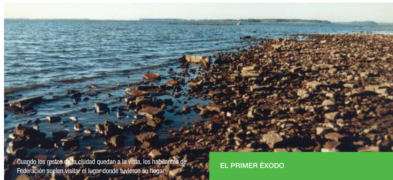
Cuando los restos de la ciudad quedan a la vista, los habitantes de Federación suelen visitar el lugar donde tuvieron su hogar.

Estaba decidido que Federación daría su vida en pos del progreso: sería relocalizada para dar lugar a la formación del embalse de la Represa de Salto Grande, hoy un espejo de agua de 78.000 hectáreas que baña las costas de la ciudad (Lago Salto Grande).