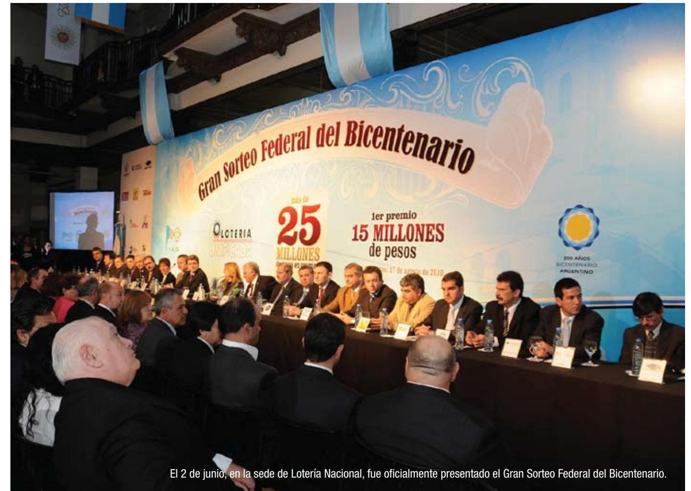
El 2 de junio, en la sede de Lotería Nacional, fue oficialmente presentado el Gran Sorteo Federal del Bicentenario.