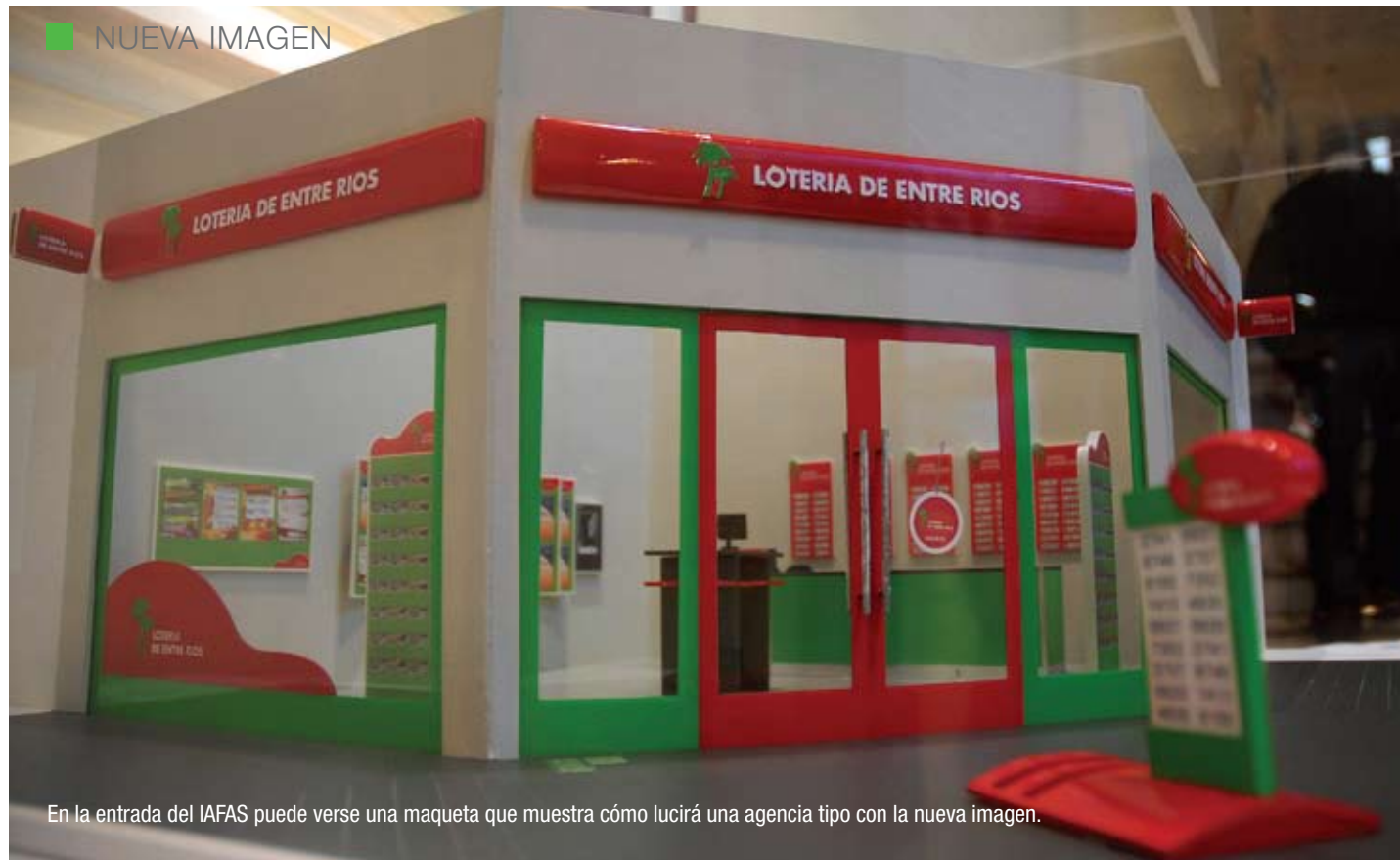
En la entrada del IAFAS puede verse una maqueta que muestra cómo lucirá una agencia tipo con la nueva imagen.