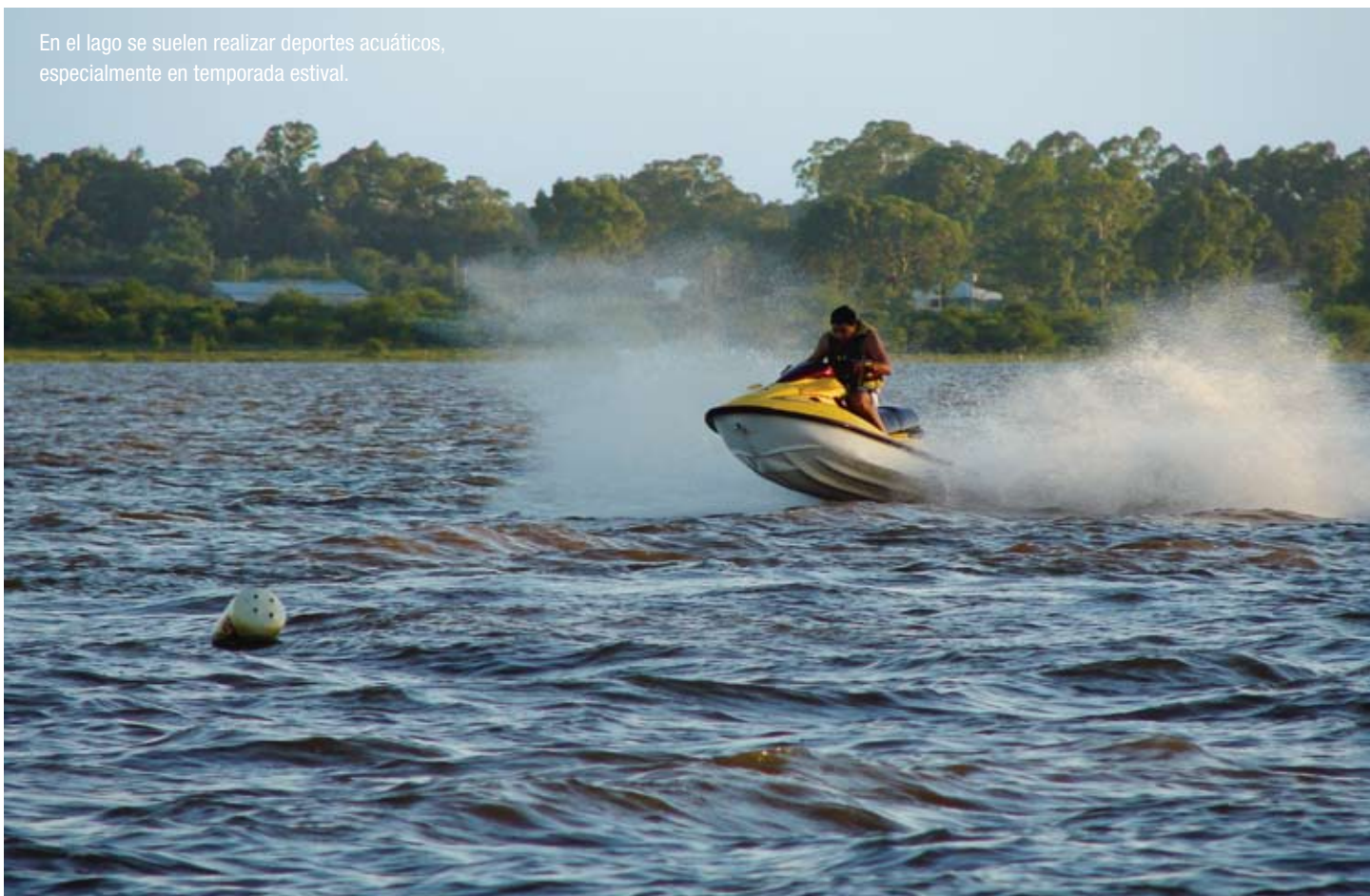
En el lago se suelen realizar deportes acuáticos, especialmente en temporada estival.

En el año 1946, el presidente Juan Domingo Perón firmó el tratado binacional con la República Oriental del Uruguay para el aprovechamiento de los rápidos del Río Uruguay en la zona de Salto Grande, con el objetivo de producir energía.