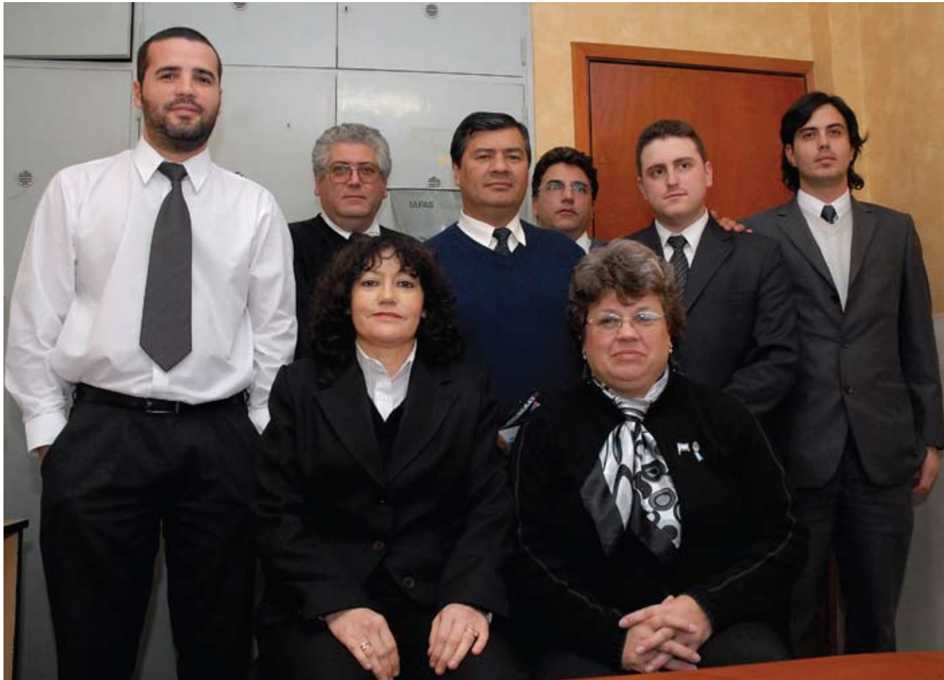
Los ocho delegados de ATE en el IAFAS nuevamente elegidos por otro período de dos años.

CON EL 51% DE LOS VOTOS, FUERON REELECTOS LOS DELEGADOS DE ATE. UNA VOTACIÓN REÑIDA EN LA QUE SE DESTACÓ EL NIVEL DE PARTICIPACIÓN DE LOS TRABAJADORES: INTERVINO MÁS DEL 90% DE LOS AFILIADOS DE LA ASOCIACIÓN.