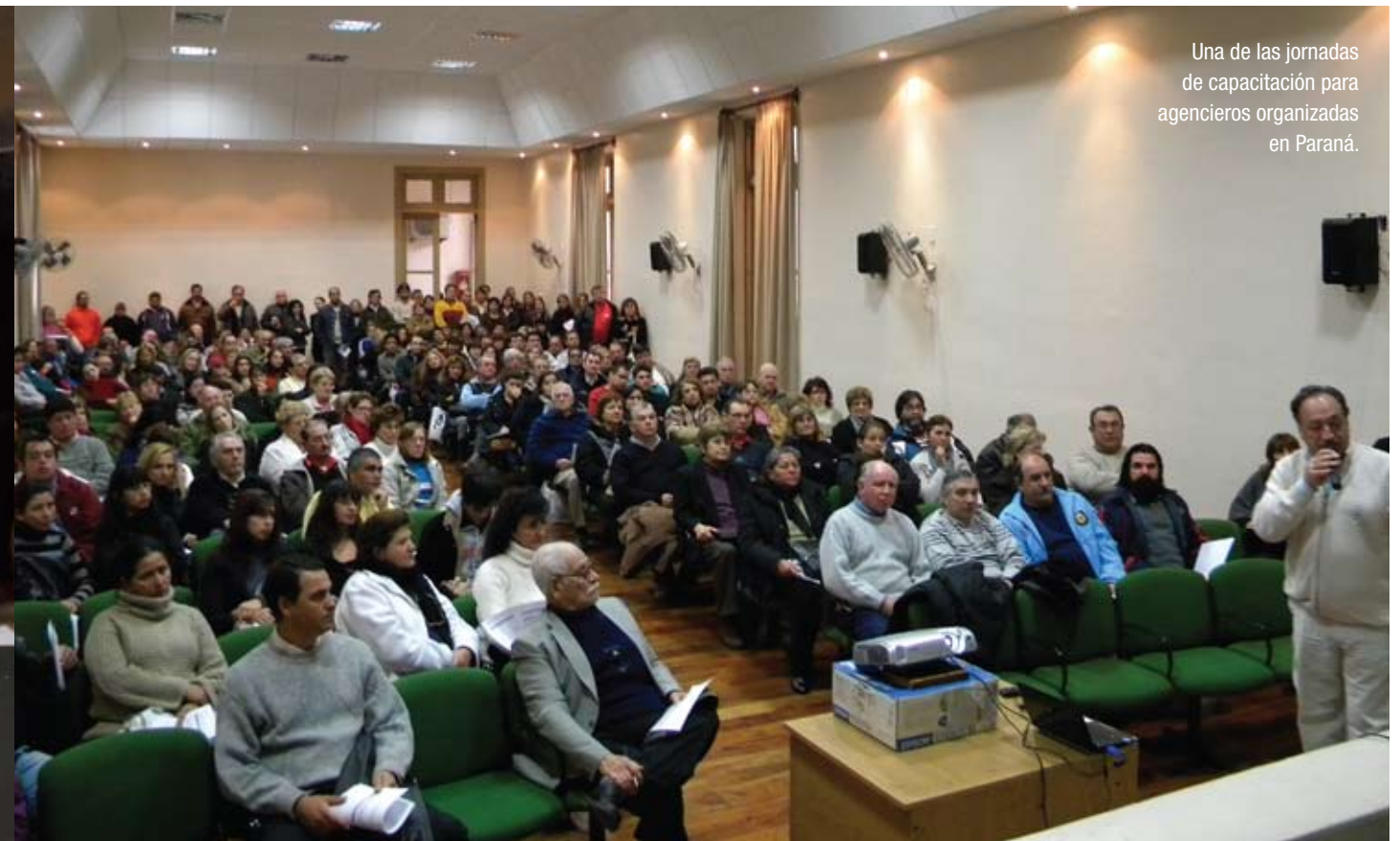
Una de las jornadas de capacitación para agencieros organizadas en Paraná.