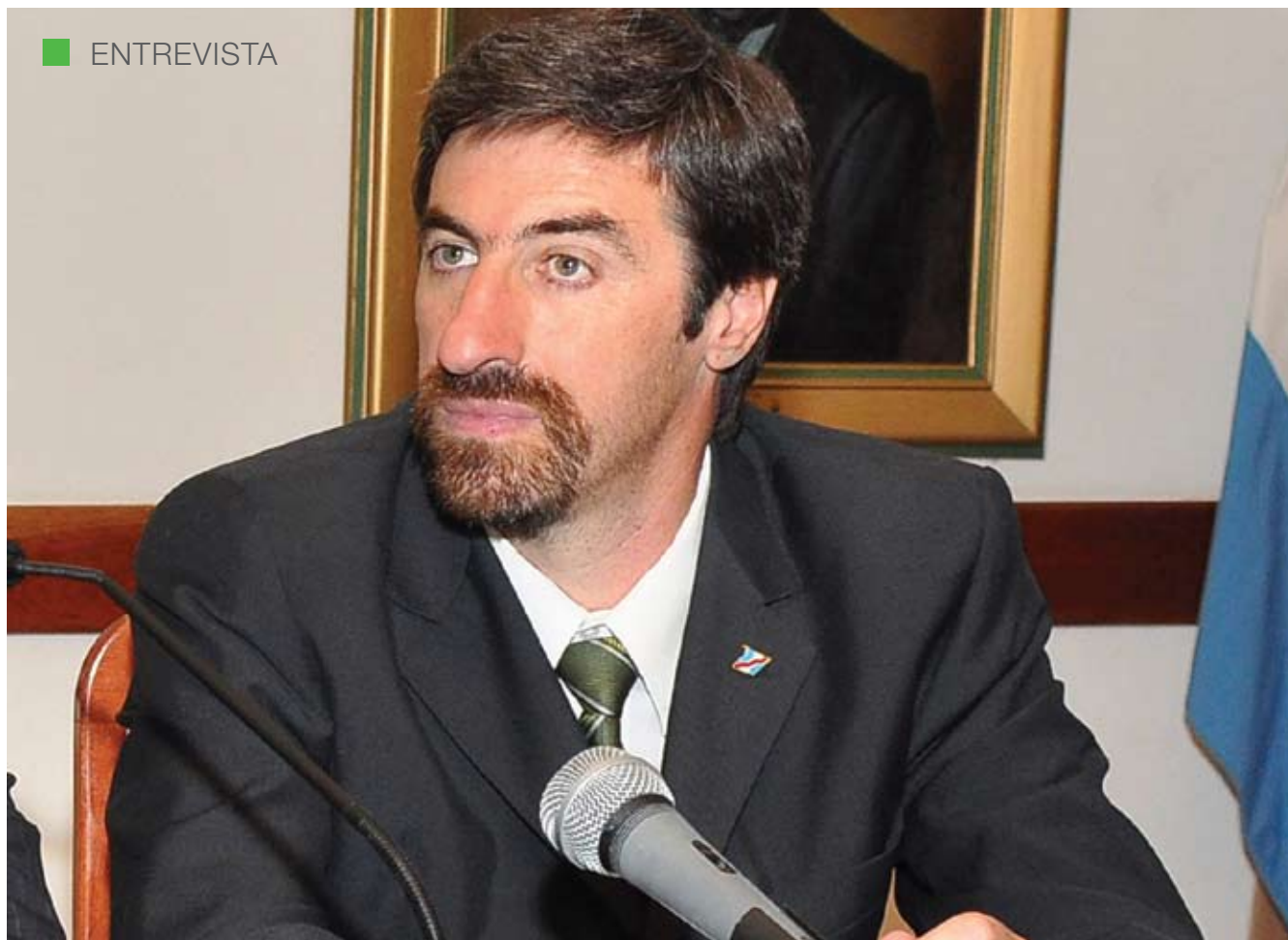
ÁNGEL GIANO – MINISTRO DE SALUD