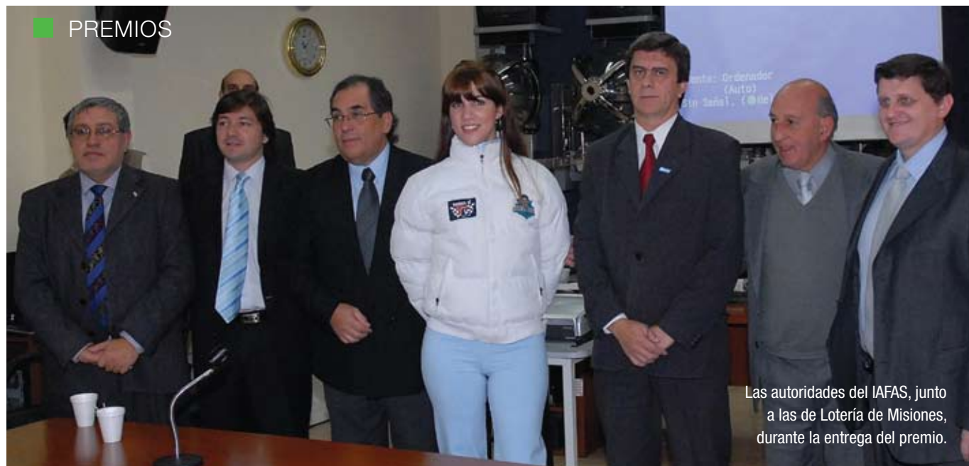
Las autoridades del IAFAS, junto a las de Lotería de Misiones, durante la entrega del premio.