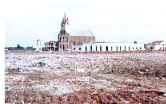
El lugar donde supo estar el pueblo, antes de que la construcción de la represa demandara su demolición y posterior inundación.

El 16 de noviembre de 1810, el General Manuel Belgrano pasó por Mandisoví cuando se dirigía al Paraguay. Allí, respondiendo al pedido de los habitantes, les adjudicó la propiedad de los terrenos que ocupaban y determinó los límites de su jurisdicción. Las sucesivas luchas internas e invasiones portuguesas dejaron en evidencia la inseguridad de su ubicación. Esa situación y otras cuestiones geográficas hicieron que el gobernador Justo José de Urquiza, el 20 de marzo de 1847, decidiera su reconstrucción a orillas del Río Uruguay. Urquiza eligió el nombre de Pueblo de la Federación, en reemplazo de Mandisoví. En ese segundo asentamiento, tuvo su auge la producción maderera.