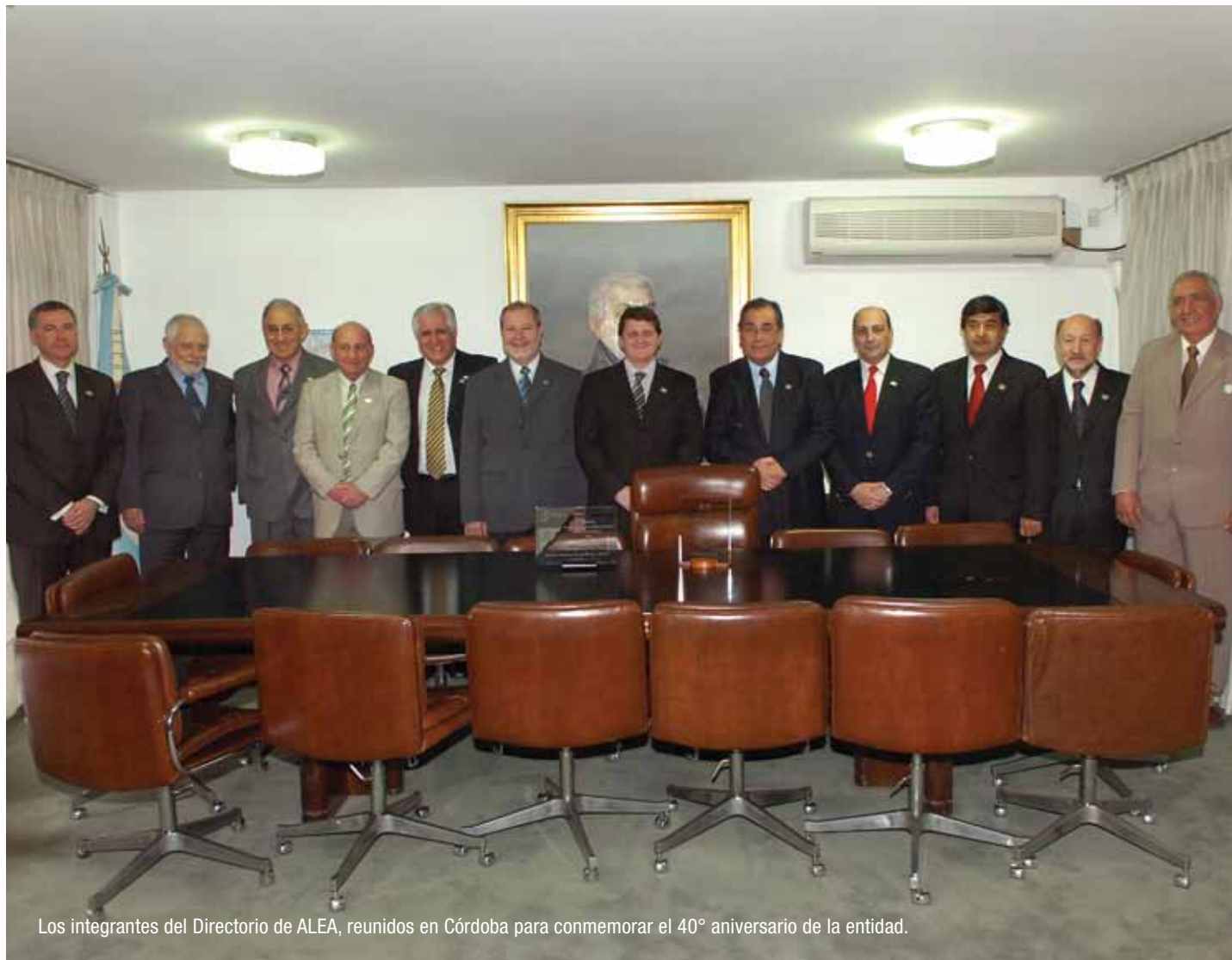
Los integrantes del Directorio de ALEA, reunidos en Córdoba para conmemorar el 40° aniversario de la entidad.