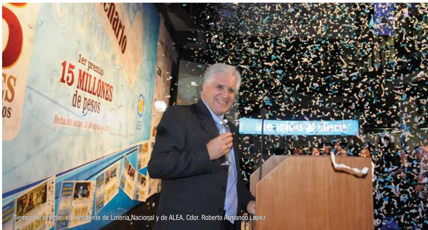
Tiempo de brindar: el Presidente de Lotería Nacional y de ALEA, Cdr. Roberto Armando López.