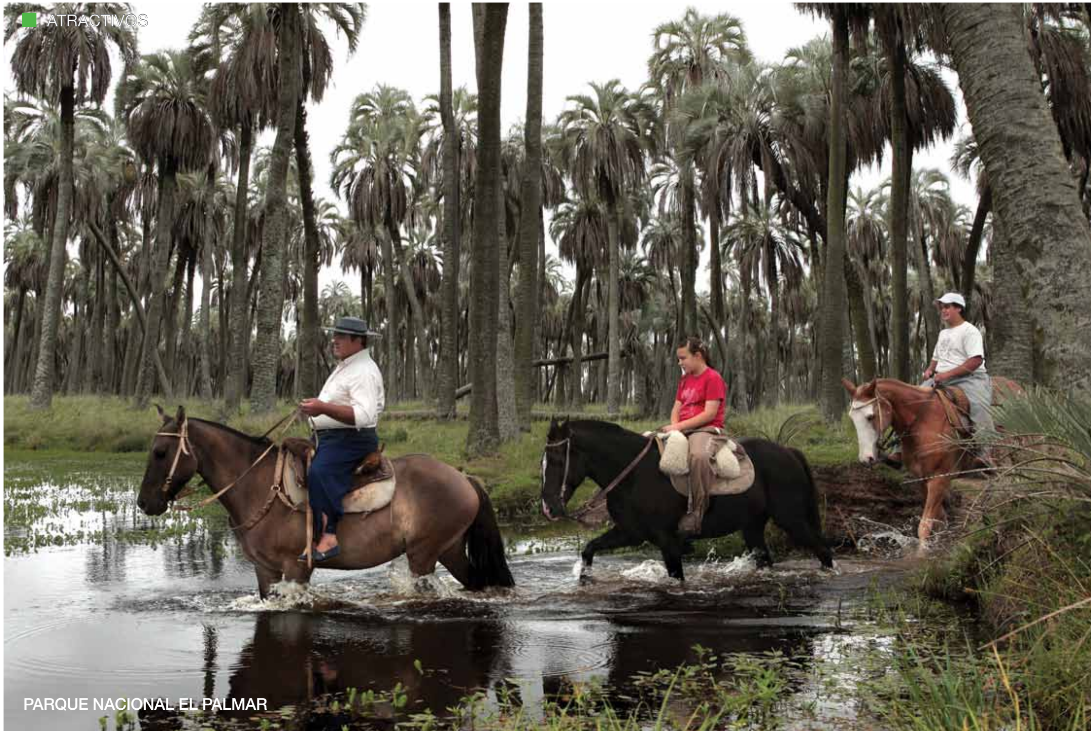
PARQUE NACIONAL EL PALMAR