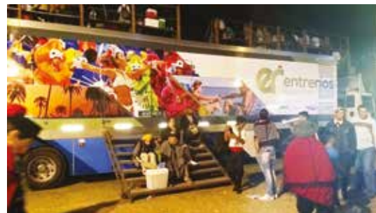
Récord de público en la tercera noche del Festival Nacional de Jineteada y Folklore de Diamante, donde estuvieron presentes, junto al camión itinerante de la Secretaría de Turismo, el IAFAS y los Casinos de Entre Ríos.

Tradicionales y únicas, las festividades entrerrianas convocaron multitudes en diversos puntos geográficos de la provincia, con sus distintivos atractivos artísticos, gastronómicos y culturales. ■